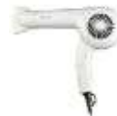
ケアライズドライヤー